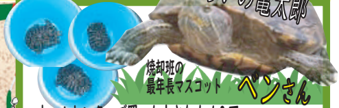
焼却班の最年長マスコット ペンさん

ミラノではまず最後の晚餐を生で見てきました! 大変人気で入場チケットも入手困難で、他国会社のツアーに我々のツアーをねじ込んだチケットで入場してきました。壁画に描かれておりましたが見た瞬間鳥肌立つくらい感動いたしました!! 水の都ベネチアではゴンドラから世界一美しい広場と言われる、サン・マルコ広場等